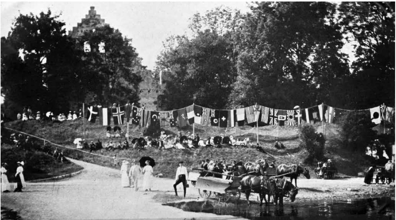
Tijdens de theosofische vredesconferentie in 1913 op het eiland Visingsö, werd de aanlegplaats in de haven omringd met de vlaggen van alle landen van de wereld.

Toen de Eerste Wereldoorlog steeds dichterbij kwam stichtte Katherine Tingley in 1913 het Parlement van Vrede en Universele Broederschap in Point Loma, Californië. Tien dagen later kondigde ze aan dat er een internationale vredesconferentie gehouden zou worden op het eiland Visingsö in Zweden. Deze plaats koos ze niet voor niets. Het eiland was in de geschiedenis ook als spiritueel centrum gebruikt. Er zijn prehistorische ruïnes aanwezig van een religieus centrum en overblijfselen van begraafplaatsen die tot in de Vikingtijd werden gebruikt. (2) Tijdens haar eerdere reizen had ze met de koning van Zweden afgesproken dat ze het land mocht gebruiken voor de oprichting van een theosofische zomerschool en nu zou daar ook de vredesconferentie gehouden worden.