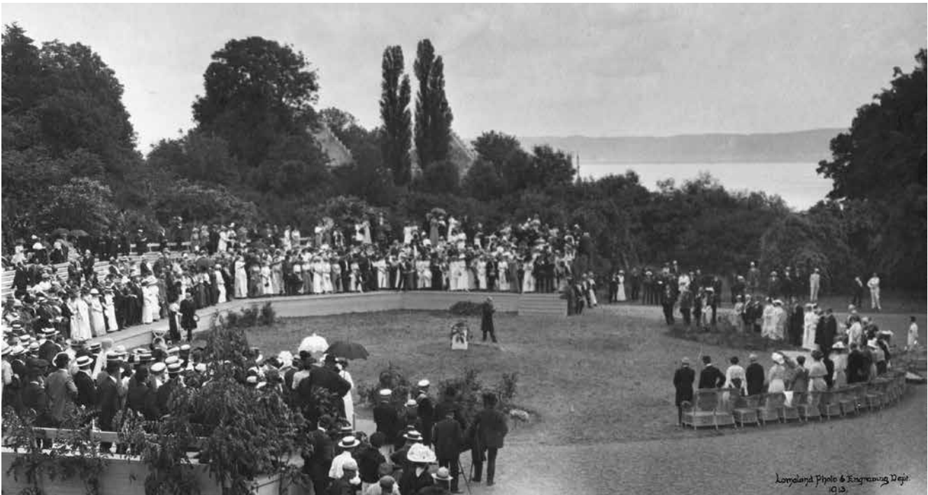
Openingsbijeenkomst van het theosofische vredescongres op Visingsö, Zweden 1913.

Aangezien in Katherine Tingley's gedachten vrede en educatie bijna synoniemen van elkaar waren, benadrukte ze beide in de aankondiging voor de conferentie: