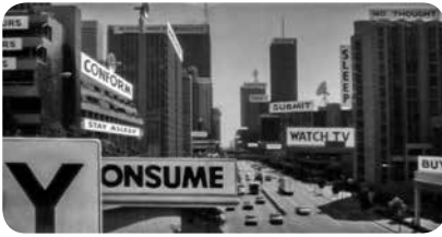
Uit de film 'They Live', 1988 Universal Studios.