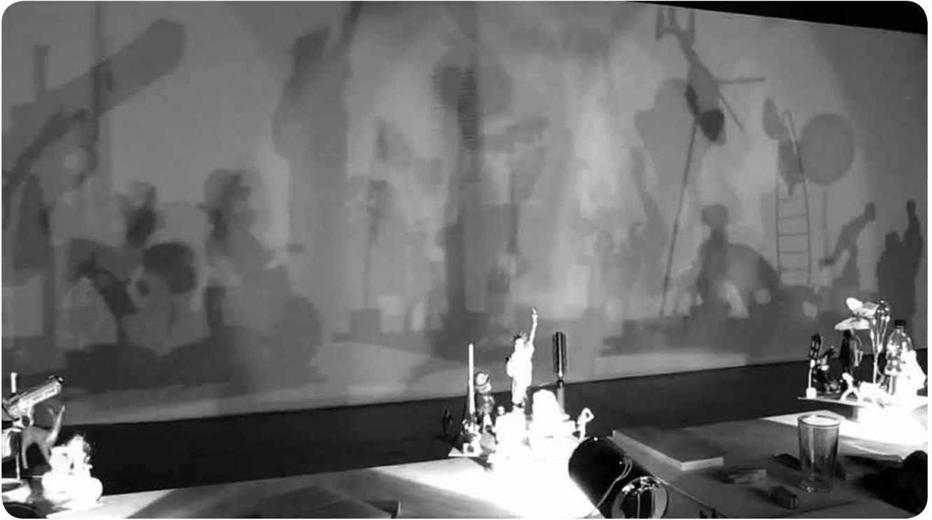
Installatie van het werk "Shadowplay" van Hans Peter Feldmann in 303 Gallery in Chelsea, New York 12 september - 17 oktober, 2009.

ten zien. Wetenschappers als Galileï en Bruno hebben dit aan den lijve ondervonden. Maar ook in onze huidige tijd worden sommige wetenschappers nog praktisch doodgewegen als hun boodschap niet past binnen de heersende paradigma's, zoals bij Rupert Sheldrake. (14)