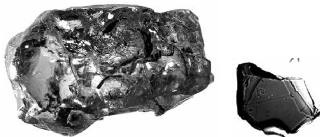
Links de diamant waarin een klein brokje van een mineraal (rechts) gevonden is, dat ons informatie geeft over de gesteentelaag 500 km diep.

Toen de seismische gegevens in een computermodel werden verwerkt, bleek dat bepaalde gesteenten op een diepte van circa 500 kilometer vloeibaarder waren dan te verwachten was. Dat wijst op de aanwezigheid van watermoleculen (in een gesplitste vorm) die hecht ingebouwd zijn binnen de mineralen. Vandaar dat deze onderzoekers tot dezelfde hypothese kwamen: de gesteentelaag van 410 tot 660 kilometer diep (de zogenoemde ‘transitiezone’ van de aardmantel) zou wel eens gigantische voorraden water kunnen bevatten.