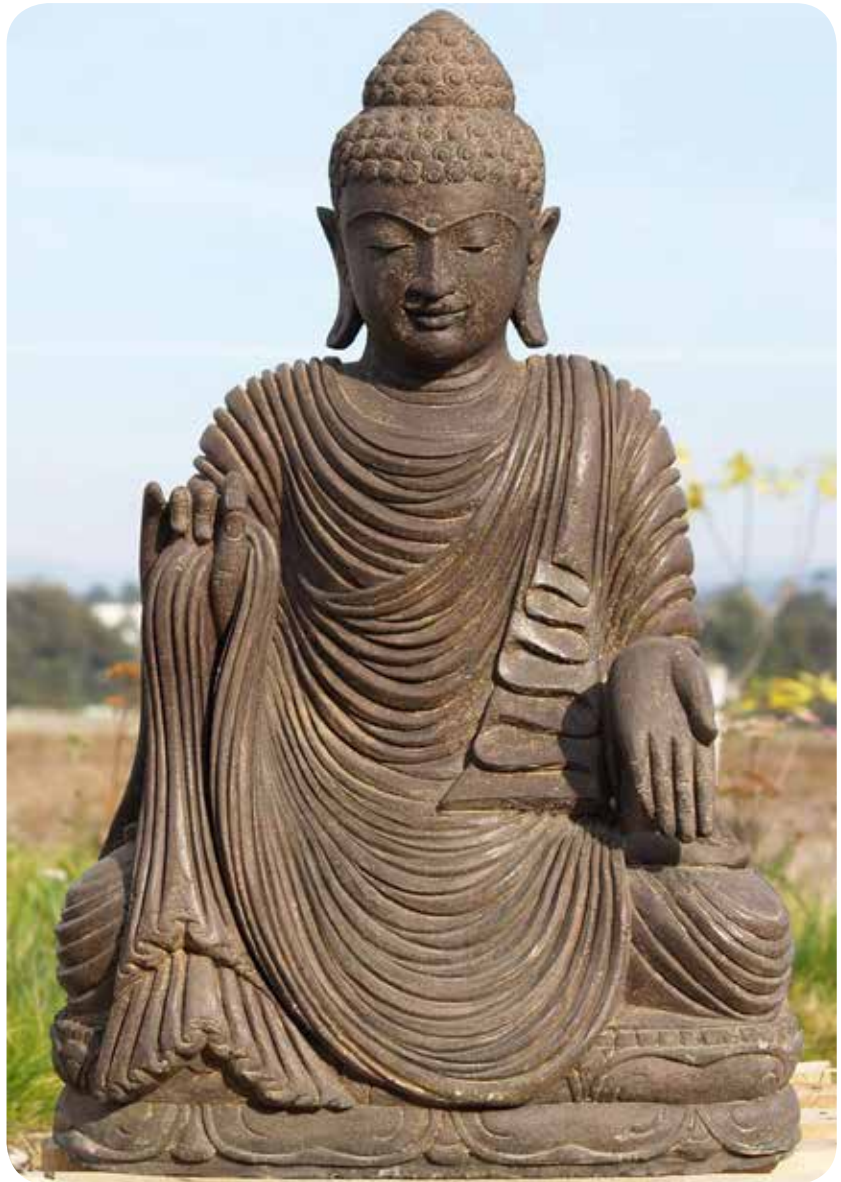
Buddha-beeld, waarvan de linkerhand mededogen symboliseert (“varada mudra”). Stenen beeld, gemaakt in Bali.

In de joodse traditie wordt God aangeropen als de Vader van mededogen en daarom aangeduid als de Mededogende of Rahmana. De rabbijnen spreken over