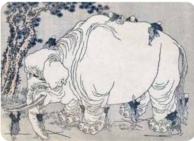
‘De blinde mannen en de olifant’. Japanse houtsnede van de ‘Manga’ (verzamelde kunstwerken) van Katsushika Hokusai, 1817

Voor we de vraag kunnen beantwoorden hoe je te weten kunt komen of haar boodschap waar is en hoe we die kunnen begrijpen, is het nodig dat we eerst uitleggen hoe we vanuit het theosofische perspectief ‘Waarheid’ zien. Want dat nu is een van de filosofisch elegante kanten van de eerste Grondstelling: dat er Eén Werkelijkheid is die aan alle manifestatie voorafgaat, maakt ons duidelijk dat er Eén alomvattende Waarheid is. Een Waarheid die eeuwig is: wat nu waar is, was waar en zal ook altijd waar zijn. Een Waarheid die alomtegenwoordig en universeel is, en dus altijd op alles van toepassing is, zodat er geen situatie kan bestaan die ermee in tegenspraak is. Maar ook een Waarheid die grenzenloos is, waardoor geen enkel gemanifesteerd en dus beperkt wezen het ooit volledig kan bevatten . Deze eerste Grondstelling voorkomt elke vorm