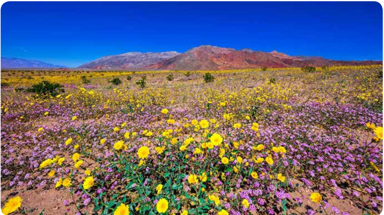
De Death Valley in kortstondige bloei.