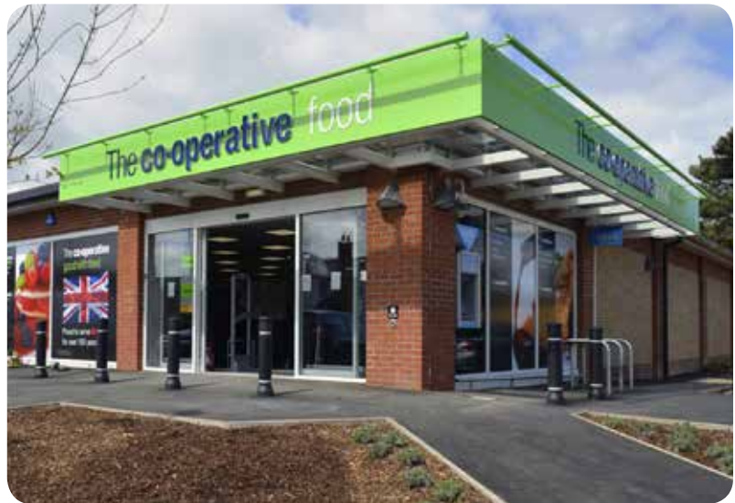
Een keten van kleinere supermarkten in Engeland, die ethische standaarden hanteert op het gebied van inkoop en energieverbruik.

Is er dan uiteindelijk – materieel gezien – per definitie genoeg op deze planeet, zonder dat het overdadig wordt? Ja, als we niet aan materiële welvaart hechten; nee, als we ons identificeren met onze uiterlijke bezittingen.