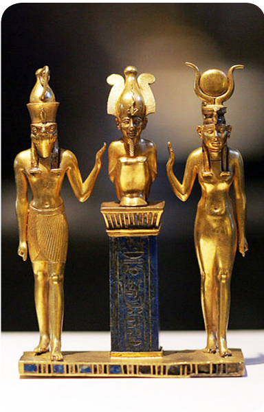
De drie-eenheid, de Bron van alle dingen, uitgebeeld als Osiris, Isis en Horus.