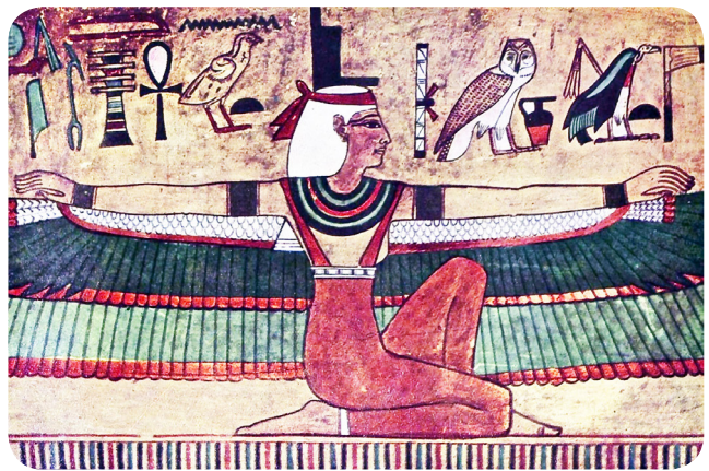
In de symboliek van het oude Egypte was Isis te herkennen aan haar hoofdtooi. Soms draagt ze een troon, zoals in deze afbeelding, soms de horens van een koe met daartussen de zonnescijf.