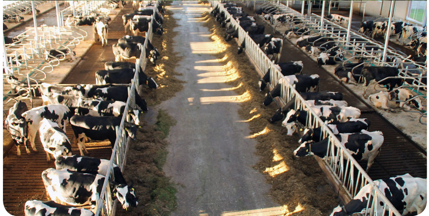
Groep wisenten in de vrije natuur en runderen in de bio-industrie.

bepaalde diersoorten uitsterven. Zo worden veel dieren in de bio-industrie gevoed met (restanten van) vissen, wat er mede toe heeft geleid dat de zeeën steeds meer leeggevist raken.