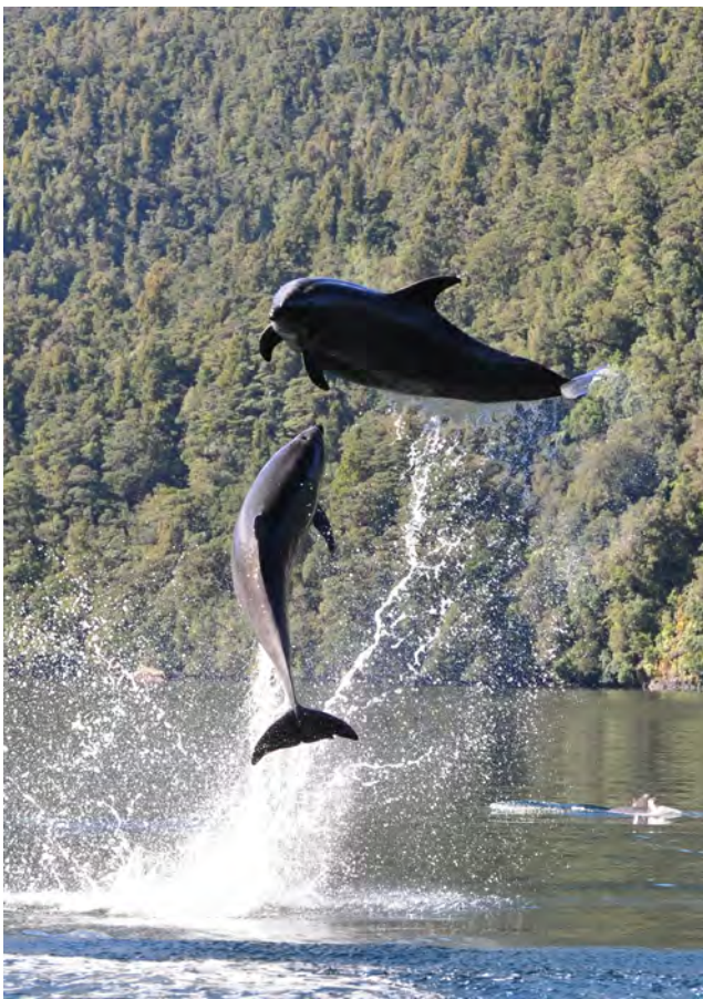
Tuimelaars in Doubtfull Sound, Nieuw-Zeeland.

Als je over voorbeelden van groepssamenwerking in het dierenrijk leest, komt wellicht de vraag op of dieren eensgezinder samenwerken dan mensen. Om daarover iets te zeggen, is het nodig dieper in te gaan op het type bewustzijn van dieren, en dat te vergelijken met ons menselijk bewustzijn. Het is nodig om uit te zoeken wat de ware betekenis is van 'instinct'. Dit verdient een aparte bespreking, die we binnenkort in Lucifer zullen publiceren.