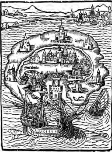
Voorkaft van het boek Utopia van Thomas More. Editie van 1516.

Door de eeuwen heen hebben mensen Utopia's bedacht: ideale landen, waar mensen gelukkig zijn. Zijn die niets meer dan luchtkastelen? Of kunnen Utopia's van nut zijn bij de ontwikkeling van de mensheid?