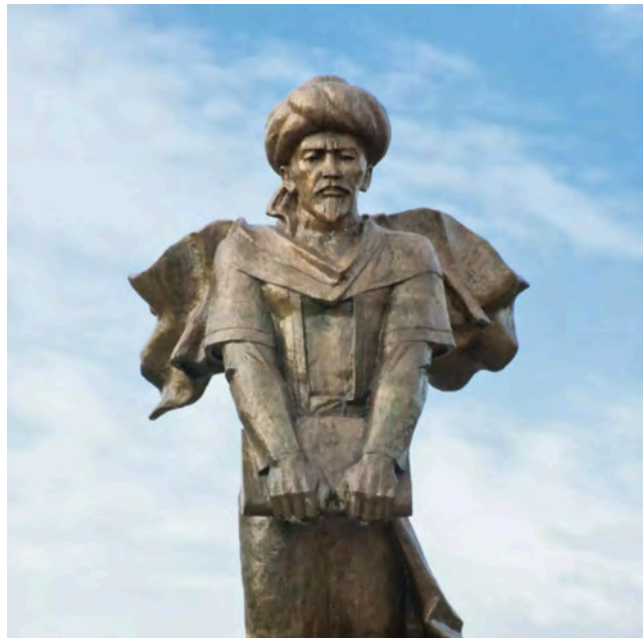
Standbeeld van Al-Farabi in Almaty, Kazachstan. Beeld van Ayana Sergebayeva.

Al-Farabi vergelijkt de deugdzame stad met zowel de kosmos als het lichaam. In beide is een hiërarchie te onder-