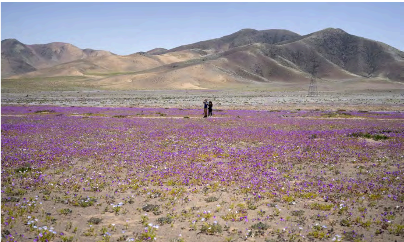
Bloemenpracht na regenval in de Atacama-woestijn in Chili.

Stel dat we vanuit die bril naar de wereldeconomie kijken, dan zullen we minder geïndustrialiseerde landen nooit dwingen om deel te nemen aan een wereldmarkt waar kleine boeren en kleinere bedrijven geen schijn van kans hebben tegenover de grote bedrijven. Die laatste immers doen of maken alles voor een veel lagere prijs, hebben forse invloed bij de ambtenaren en in de politiek. En ze zijn in