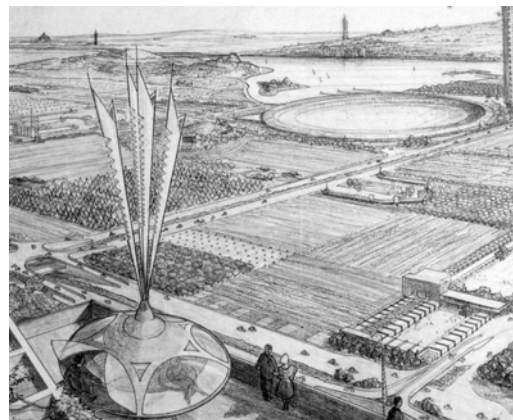
Frank Loyd Wright's utopia: Broadacre City.