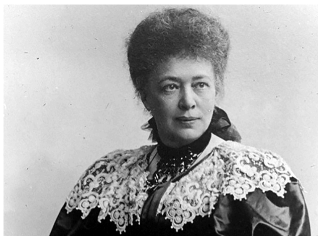
Bertha von Suttner.

Bertha von Suttner had tijdens beide conferenties een groot informeel, moreel gezag . Bedenk: zij deed formeel niet mee, ze was niet door een land als vertegenwoordiger gezonden. Maar ze deed alles om informeel gezag te