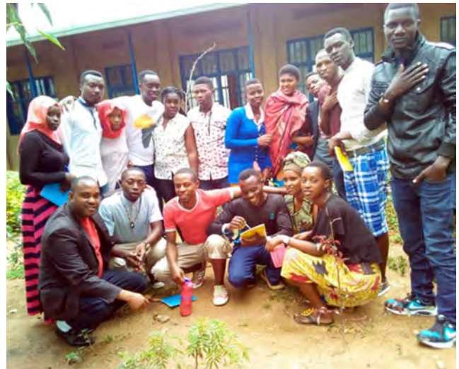
Het Karuna Centre for Peacebuilding in Rwanda zette van 2016 tot 2019 vele activiteiten op om de trauma's van de genocide in 1994 duurzaam te verhelpen, geheten 'Healing our Communities Program'.

We zien dat de wijze waarop er wordt geholpen heel belangrijk is om niet méér problemen te veroorzaken. Bij werkelijk helpen houd je de totaliteit in ogenschouw, met inachtneming van het verleden en zicht op de toekomst. Dat vraagt om wijsheid. Je moet goed nadenken over de oplossingen en de hulp die je biedt. Zowel spiritueel, mentaal als fysiek. Dat betekent dat je hulp geeft vanuit een houding van mededogen. (2) Dat wil zeggen trachten de ware oorzaken van lijden te ontdekken en je medemensen erop te wijzen hoe die oorzaken kunnen worden weggenomen. Kennis van de Natuur is daarvoor nodig. De Theosofia biedt ons hiervoor inzicht in drie soorten taken die door de leraren van de Loge van Wijsheid en Mededogen al sinds mensenheugenis worden uitgevoerd om de mensheid op weg in haar ontwikkeling te helpen. Deze taken zijn Inspireren van de mensheid, Beschermen tegen negatieve invloeden en Genezen. (3) We zullen onderzoeken hoe wij ze als richtlijn kunnen toepassen in en bij het geven van werkelijke hulp.